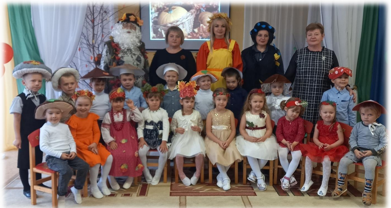
Средняя группа №1 "Ягодка"

И сама осень-красавица заглянула к нам на праздник. Она играла, танцевала и веселилась вместе с ребятами. Праздник в детском саду – это всегда удивительные чудеса, волшебные краски, звонкий смех воспитанников, море улыбок и веселья. Хотя и говорят, что осень унылая пора, но дети как никто другой, способны радоваться шороху золотистых опавших листьев под ногами, дождю, под которым так интересно гулять под зонтиком, обув резиновые сапожки. Мероприятие было веселым, ярким, увлекательным. Воспитанники получили много позитивных эмоций и остались довольны праздником.